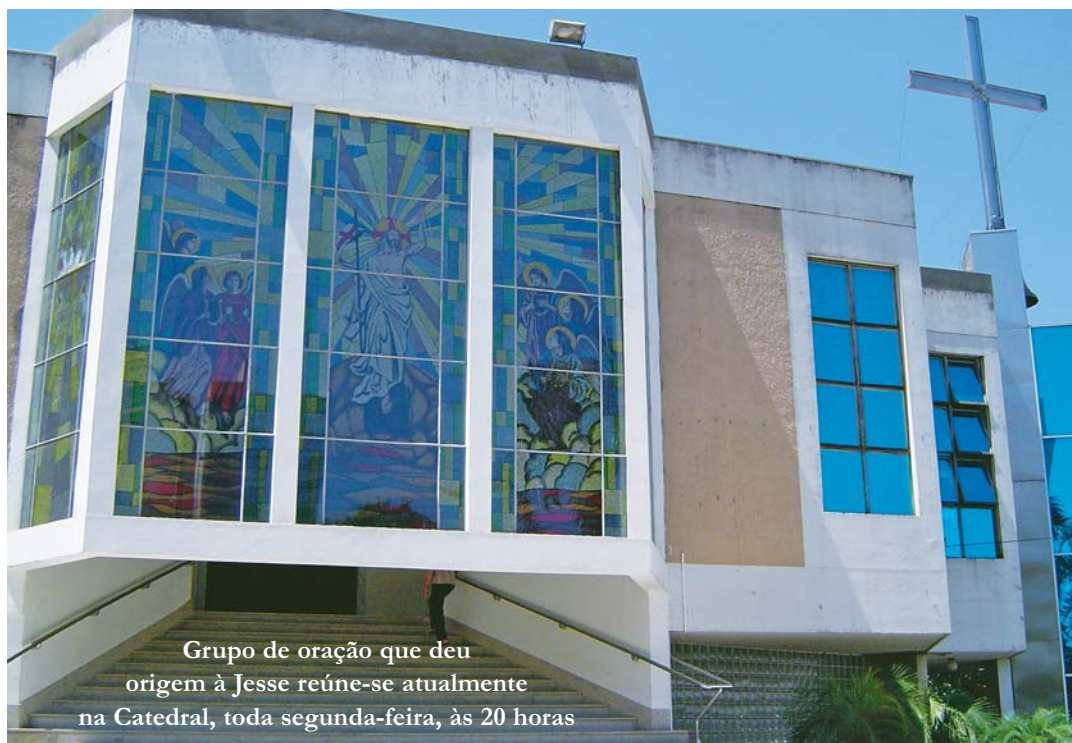
Grupo de oração que deu origem à Jesse reúne-se atualmente na Catedral, toda segunda-feira, às 20 horas

Temos, ainda, muito a fazer. Já adquirimos terreno e iniciamos a construção da sede própria, atualmente paralisada. Continuamos em crescimento e continuaremos sempre a caminhar à sombra do Altíssimo.